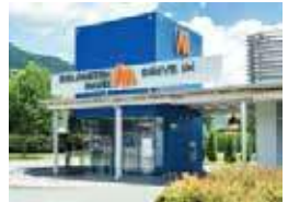
Kötschach / Drive in